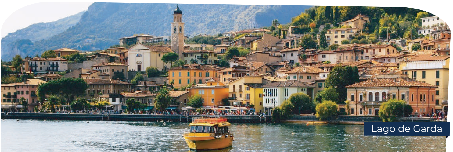
Lago de Garda

Desayuno en el hotel. Salida para efectuar la visita de la ciudad a pie finalizando en la plaza de San Marcos, e incluyendo la visita a un taller del famoso cristal veneciano. Tiempo libre para almorzar en la ciudad. (Almuerzo incluido en P+). Podemos aprovechar para hacer un paseo en Góndola por los canales venecianos. (Paseo en góndola incluido en el Paquete Plus P+). Alojamiento.